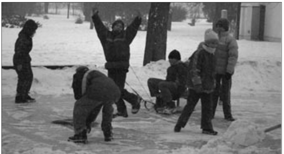
Gyermeki öröme a jégpályán