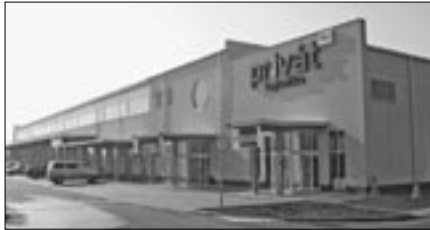
Hat megyébe szállítják a logisztikai központból az élelmiszert

Megtudtuk, 7000 árucikket tart a Forrás raktáráruháza. Az ügyvezető elmondta, Ebes 120 kilométeres körzetéből szállítja tőlük a megrendelt árut 460 Privát üzlet képviselője. Március eleji beszélgetésünkön száraz-, hentes-, tej- és előhűtött mirelit termékeket értékesítettek, s az ügyvezető jelezte, hogy néhány nap múlva nyit benzinkútjuk és 1-2