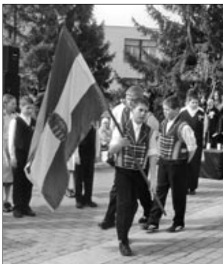
Az Arany János iskola tanulói adták az ünnepi műsort

Széchenyi nem a lángoló forradalomnak, hanem a megfontolt, meggondolt reformoknak volt a híve. Mindezek ellenére a Batthyány kormány közlekedési minisztere lett.