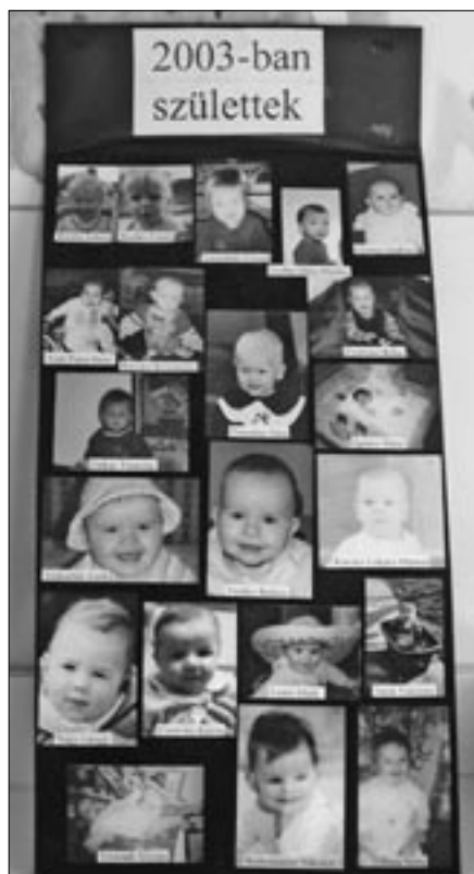
Összeállította: Heidumné Szarka Veronika