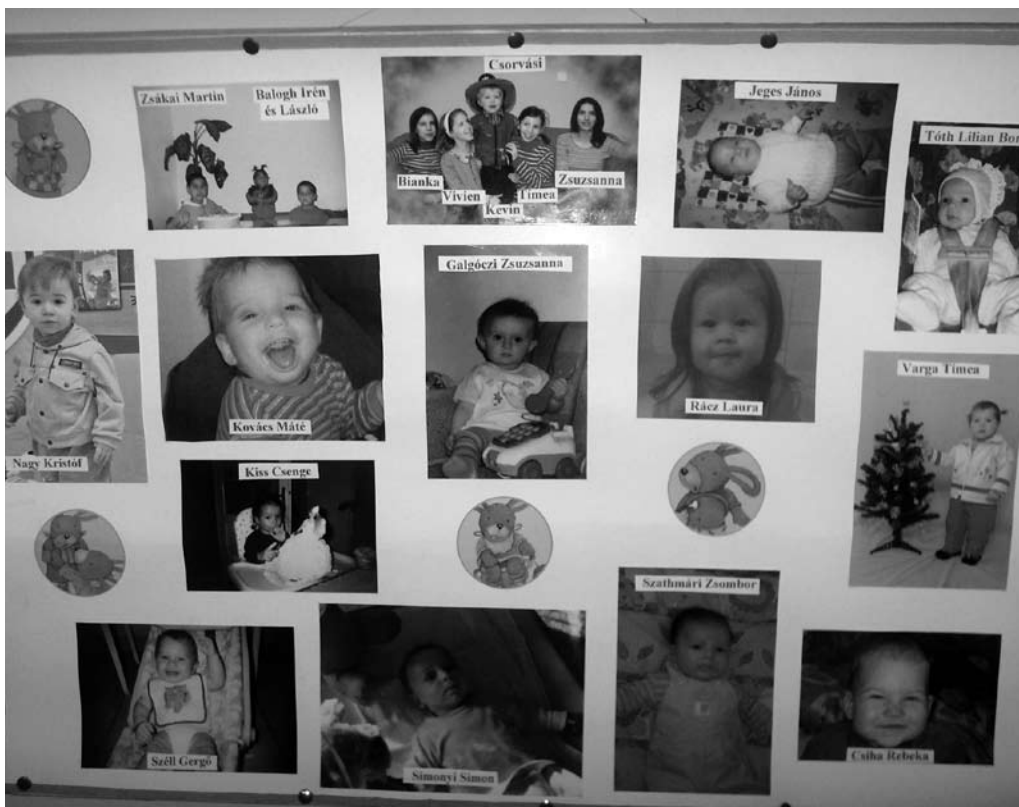
Összeállította: Heidumné Szarka Veronika