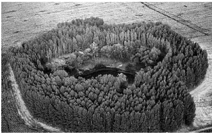
A nagyhegyesi Kráter-tó légifelvétele