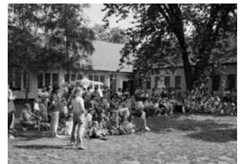
Gyermeknap az óvodában