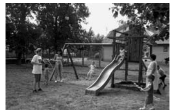
Campona mászóházát birtokba vették az ovisok

Átmenetileg a korábbi szám 30/500-33-77 is működik átirányítással 2007. július 1-jéig.