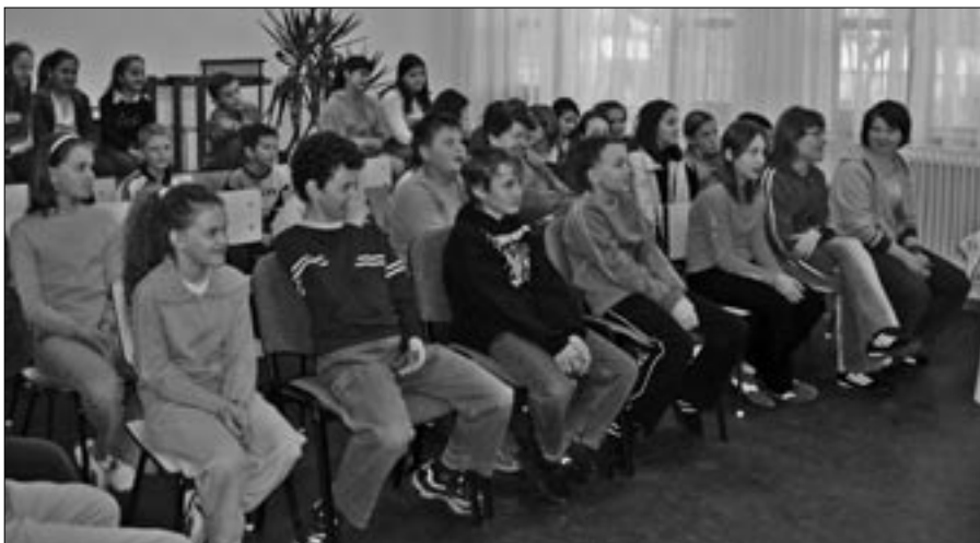
Jó hangulatúak a vetélkedőkkel tarkított teadélután