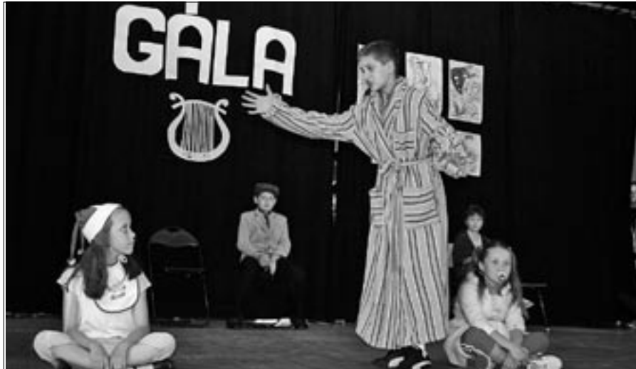
A színjáték tanszak növendékei Janikovszky Éva: Kire ütött ez a gyerek? – című művét adják elő Bálintné Bagdy Ibolya rendezésében

királynét választott, a színjáték tanszak Janikovszky Éva: Kire ütött ez a gyerek? – című humoros művét adta elő. Majd dél-alföldi ugrósról mutattak be a néptáncosok. A Shrek című film zenéje táncba hívta a lányokat, Mozart Török indulója szóló, s a fűvósok a My way című számmal kellemes nyáresti hangulatot varázsoltak. Végül a néptáncscsoport Májusfa kitáncolást mutatott be „eltemették” a 2004/2005-ös tanévet. „Éljen a vakáció! – kiáltották.