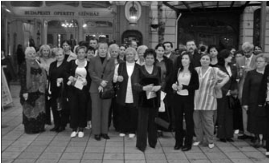
Az ebesi közönség az Operettszínház bejáratánál