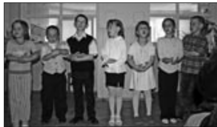
Az óvodások műsort adtak