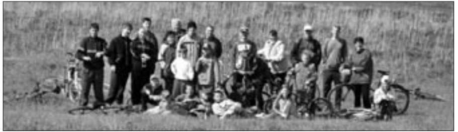
Húsz kilométert kerékpároztak a templomdombig és vissza

EBESI HÍRLAP. Ebes község önkormányzata időszaki lapja. Főszerkesztő: Császi Erzsébet E-mail: csasz@freemail.hu A szerkesztőség címe: 4211 Ebes, Széchenyi tér 1. Tel.: 52/565-048, fax: 52/565-075. Kiadja: Ebesi Kulturális Kht. Alapította: Ebes község képviselő-testülete. Felelős kiadó: Rózsahegyiné Juhász Éva. Nyomdai munkálatok: Fount Trade Kft.