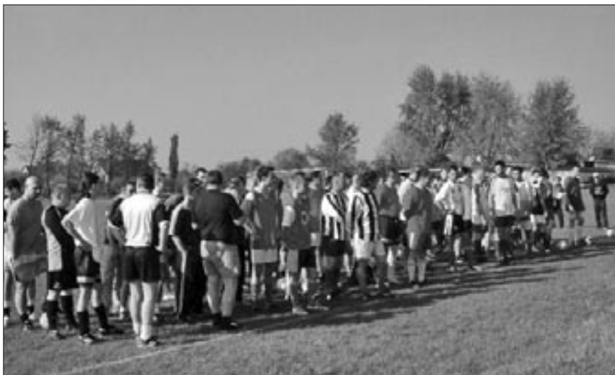
Szép számmal neveztek a csapatok a futball bajnokságra