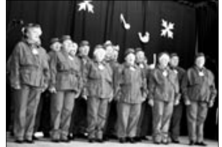
„Honvéd banda szól a...”