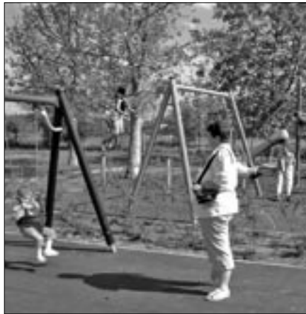
Birtokba vették a gyerekek a játszótér

A rendszer kiépítésre pályázaton szeretne indulni az önkormányzat, de 2-3 éve nincs ilyen lehetőség a korábbi kiíró szerv, az Országos Bűnmegelőzési Alap részéről sem, így azt a saját költségvetéséből kell megoldani. Az alap felszerelést – 3-7 millió forintba kerül –, még az idén szeretnék megvásárolni és beüzemelni. A kamerákat a Széchenyi tér, középületek, templomok, játszótér, sportpálya megfigyelésére, megóvására használják – ismertette Galgóczi Mihály polgármester.