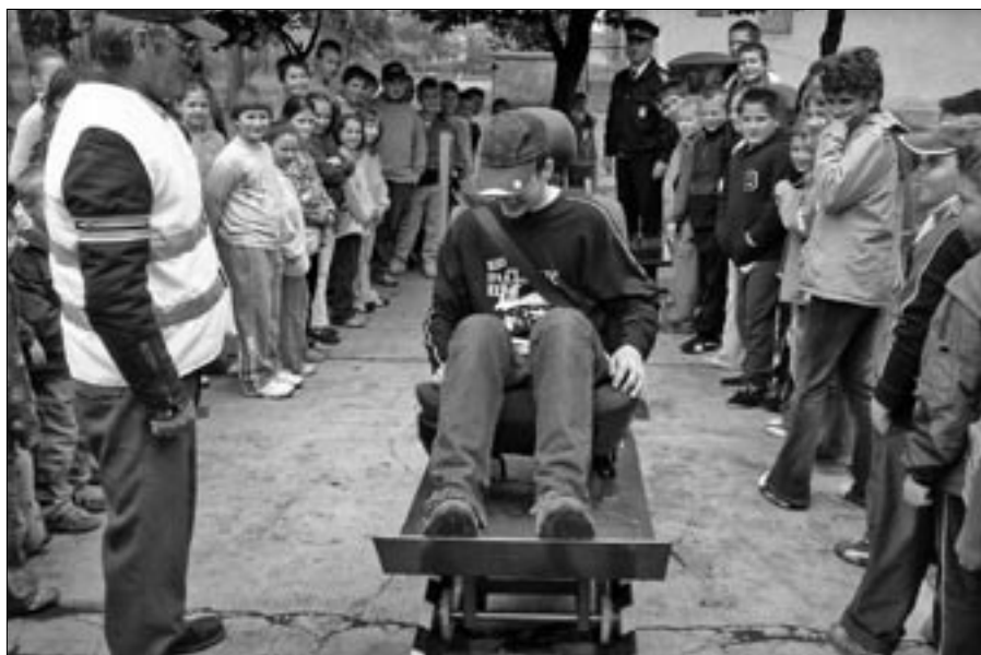
Nagy sikere volt a biztonsági öv szimulátornak