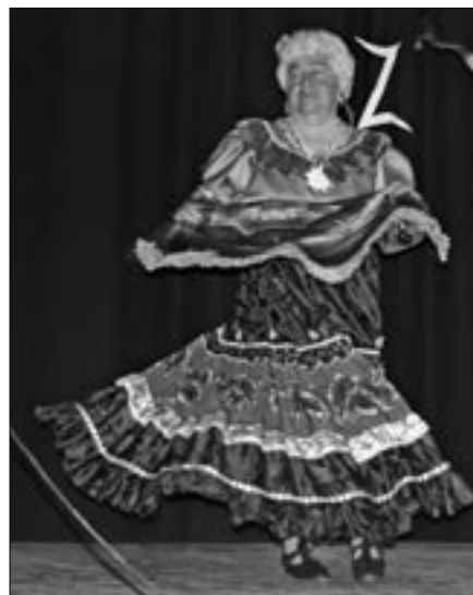
Humorban, zene- és nótaszóban nem volt hiány