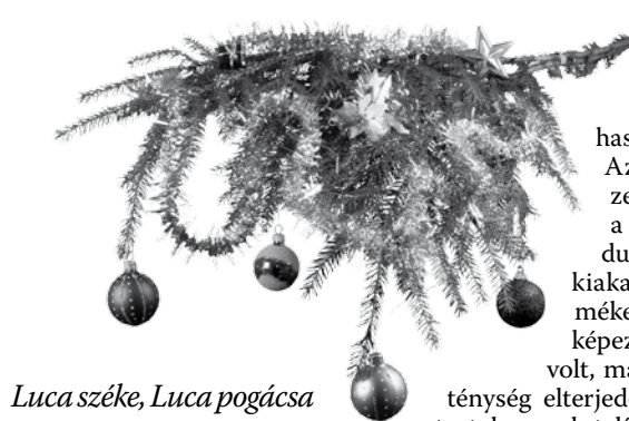
Luca széke, Luca pogácsa

Miklós (december 6.): A kizsátsai Myrában élő Szent Miklós püspök a keleti egyház legtiszteltebb szentjei közé tartozik. A görög katolikusoknál emléknapja még ma is kötelező ünnep, míg a római egyház a 16. sz. végén eltörölte annak kötelező jellegét. Miklós püspök jótéteményeiről vált nevezetessé, s ő lett a halászok, révések, vízimolnárok ill. a folyók mellé települt magyarországi bencés apátságok védőszentje. Ma két arcú Mikulás él a hagyományokban ill. a kétféle elem legtöbb helyen összeolvadt: egyik a szent püspök legendájával összefüggő, éjjel titokban ajándékok osztogató jóságos öregember; a másik a számonkérő, felelősségre vonó, bírói szerepet magára öltő alak. Dunántúlon a közelmúltig élt a szokás, hogy Miklós napján a legények, sőt nős férfiak is bekormozott arccal, kifordított bundában láncot csörgetve ijesztgették a gyerekeket és nagyobb lányokat.