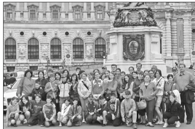
A csoport a császári palota előtt

Másnap reggel a buszról láthattuk a nagycenki Széchenyi-kastélyt és a kismartoni Eszterházy-