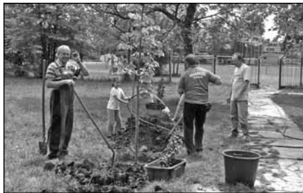
Hagyomány lesz a takarítás utáni faültetés...

biztosított kesztyűvel és zsákokkal felszerelve 25 polgárör és családtagjaik, 53 óvoda, szülei és az óvodai dolgozók, 192 iskolás, szülei és tanárai igyekeztek összegyűjteni az eldobált szemetet a falu területén.