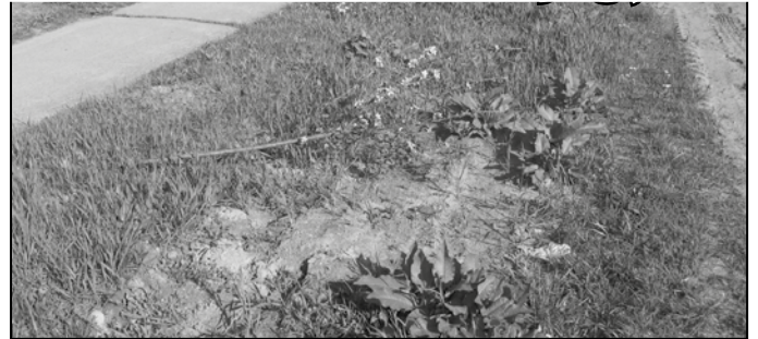
Vajon kiknek volt útjában a fiatal díszszilvafa? Felvételünk Húsvét után készült a Fő utcán