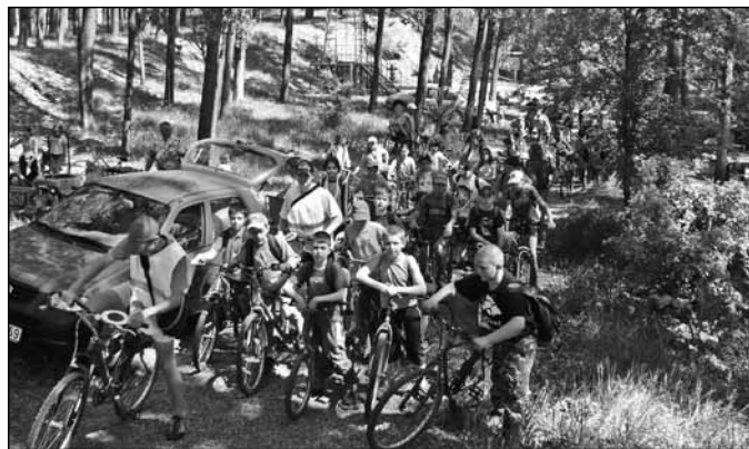
A népes csapat

lángokról, defektes gumikról felkészült szerelőgárda, valamint egy „profi szervizautó” is gondoskodott.