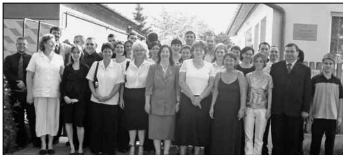
Az esti gimnázium hallgatói és tanárai

Másfelől nagyon jó a helyi közösség. Az emberek elfogadták, hogy felpezdült az élet, hiszen