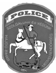
Rendőrségi hírmondó 4. oldal