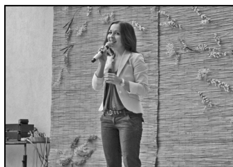
Esőben is közösségben, együtt – 1. oldal