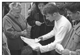
Tavaszi Nagytakarítás 8. oldal