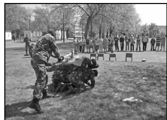
A Kossuth Laktanyában jártunk – 7. oldal