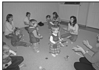
Századszor is elbújtak a hangok – 7. oldal