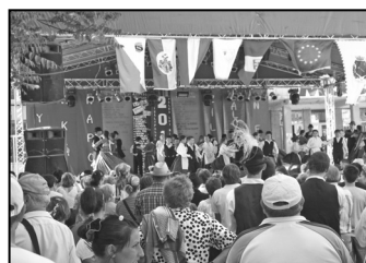
Érmihályfalván jártunk 4. oldal