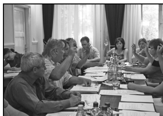
A képviselő-testület májusi üléséről – 2. oldal