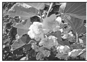
Virágzik a kivi Ebesen 7. oldal