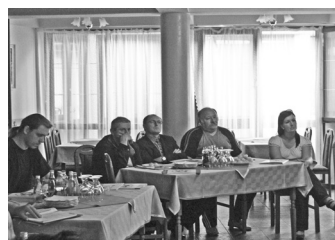
Vállalkozói fórumot tartottak Ebesen – 3. oldal