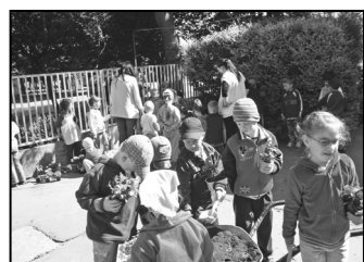
Madarak és fák napja az óvodában – 6. oldal