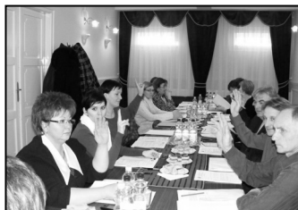
Beszámoló a képviselő-testületi ülésről – 2-3. oldal