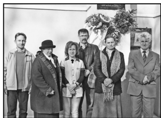
Szeretet határokon át – 6. oldal