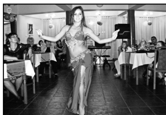
Ismét jó hangulatban segítettünk – 5. oldal