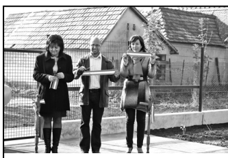
Átadták a Béke utcai játszótér – 4. oldal