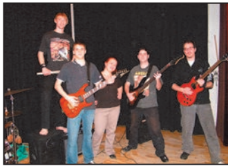
Lelkesedésből nincs hiány 4. oldal