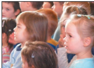
Víz Világnapja az óvodában 5. oldal