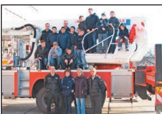
A Debreceni Tűzoltóságon jártunk! 6. oldal