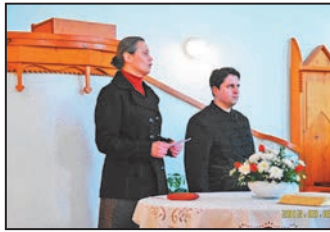
Orgonakoncert 4. oldal