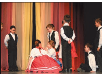
Projektzáró rendezvény 5. oldal