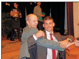
IV. Batus Sportbál 10. oldal

Ebes Község Önkormányzatának Képviselő-testülete nevében minden kedves Ebesi lakosnak kellemes húsvéti ünnepeket kívánok!