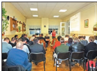
Segítség a bajba jutottaknak 8. oldal