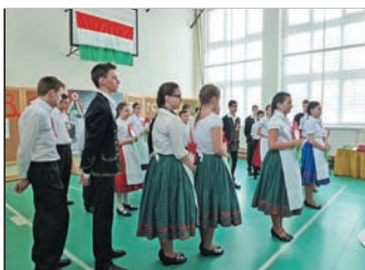
Március 15-ei megemlékezés 6. oldal