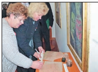
„Petőfitől Petőfiről” nyílt kiállítás – 5. oldal