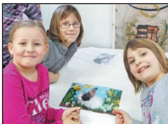
Tavaszcseré családi nap a múzeumban – 9. oldal