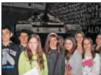
Látogatás a Terror Háza múzeumban – 7. oldal