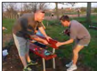
Ifjúsági park épült 5. oldal