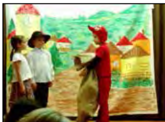
Iciri-piciri bábtalálkozó 6. oldal