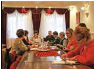
Szociális szövetkezet létrehozásán gondolkodnak – 2. o.