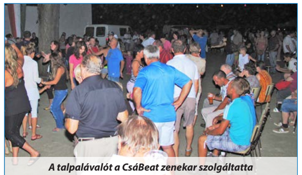
A talpalávalót a CsáBeat zenekar szolgáltatta