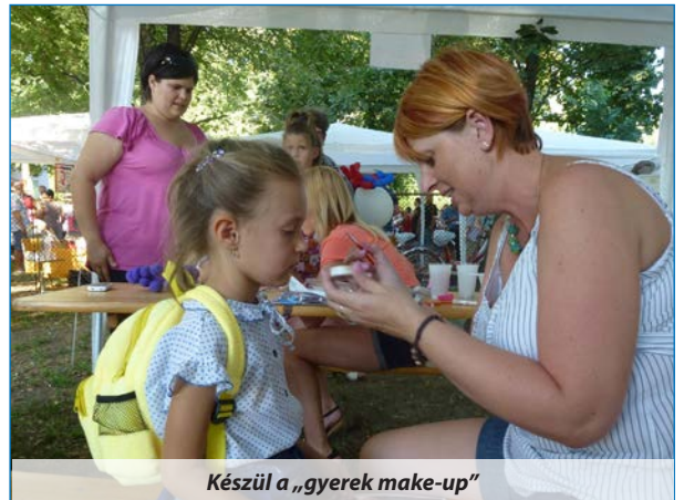
Készül a „gyerek make-up”