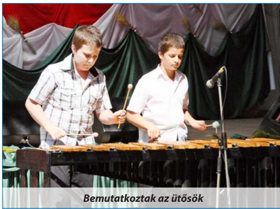
Bemutakoztak az ütősök