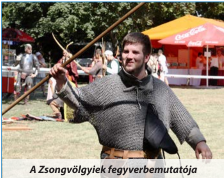
A Zsongvölgyiek fegyverbemutatója