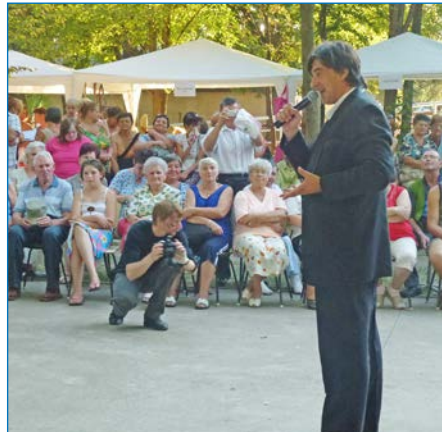
A Tihanyi Vándorszínpad ünnepi operett műsora

étkek készítőinek elismerése következett. Az idei rendezvény sztárfellépőjét, Bangó Margit Kossuth-díjas előadóművészt nagyon várta már a közönség, aki fergeteges hangulatot varázsolt a színpadra és táncra perditett sokakat.