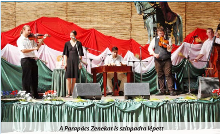
A Parapács Zenekar is színpadra lépett