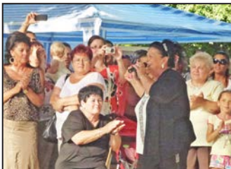
Szent István napi sokadalom 6. oldal

Bővebben a 3. oldalon olvashatnak felhívásunkról.