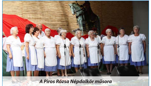
A Piros Rózsa Népdalkör műsora