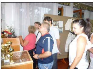
„Sportélet Ebesen 1955-től napjainkig” – 9. oldal