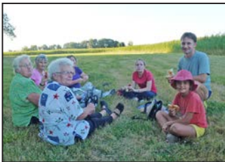
Koszorúzás és zárandoklat 7. oldal