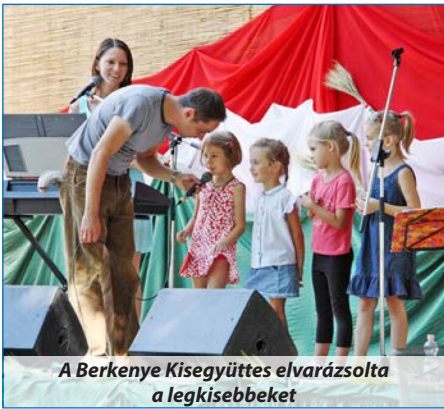
A Berkenye Kisegyüttes elvarázsolta a legkisebbeket