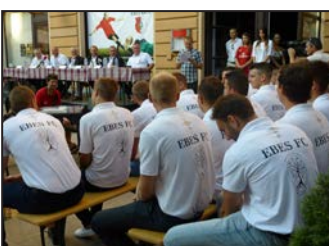
Az Ebes KKSE augusztusi hírei – 10. oldal