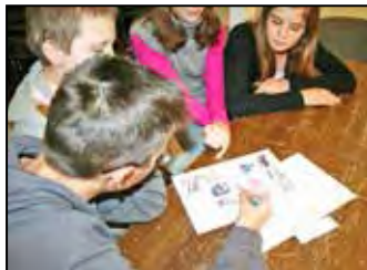
...amit minden falusi gyereknek tudnia kell – 10. oldal