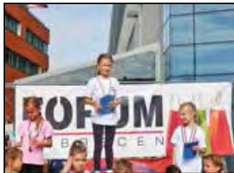
Fórumfutás 11. oldal