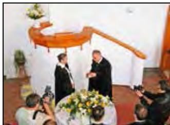
„De nekem olyan jó Isten közelsége!” – 5. oldal