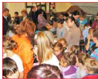
Érdeklődők és kiállítók a kisállat kiállításon

Ökoiskolánkban a hagyományos papírgyűjtés mellett, októberben két olyan rendezvény is volt, amivel a tudatos, természetere figyelő életmódot népszerűsítettük. Az Állatok világnapján „Kisállat kiállítást” szer-