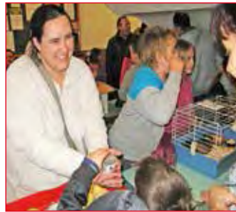
A sün, akit meg lehetett simogatni

Október 10-e a Komposztálás ünnepe. Most mi is csatlakoztunk ehhez az országos megmozduláshoz. A szünetekben a kompostáló név, vicces automatával megtudhattuk, hogyan kell a zöldhulladékokat helyesen komposztálni. A kartonból készült játékok egy tanuló bújik meg, aki a kompostáló oldalán bedobott dió koppanására egy kérdést mutatott fel a kíváncsi diáknak. A játékos buda a kezét az általa helyesnek vélt