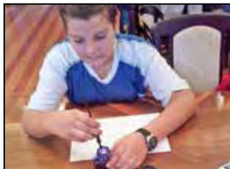
Sárospataki kirándulás 9. oldal