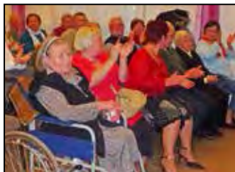
Idősek napja 6. oldal