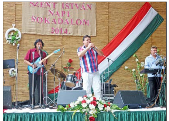
Csocsesz és Barátai fergeteges bulija