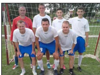
Az Ebes KKSE hírei 11. oldal