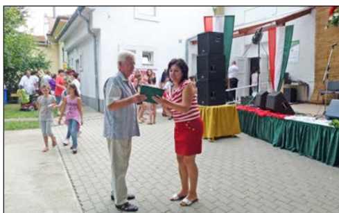
Elismerés átadása a lakókörnyezet tisztán tartásáért