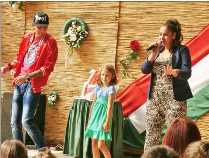
Fatima zenéjére a legapróbbak is táncra perdültek