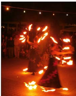
A tűzszönglörök ámulatba ejtették a közönséget