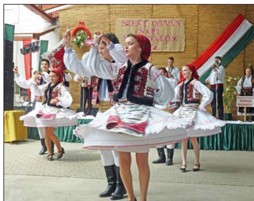
Perdültek a szoknyák a román táncsoport leányain