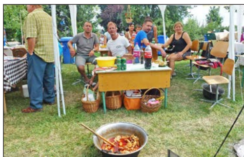
Elkészült az ízletes ebéd