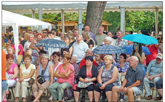
Jól szórakoztak, akik kilátogattak a rendezvényre