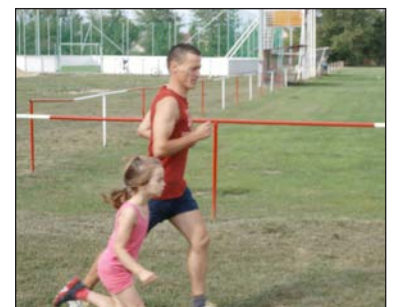
Sportversenyekkel kezdődött a délelőtt