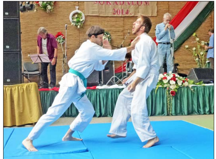
Fergeteges karate bemutató