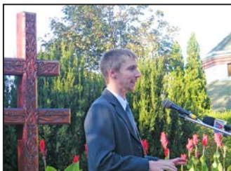
Koszorúzás és zárandoklat 8. oldal