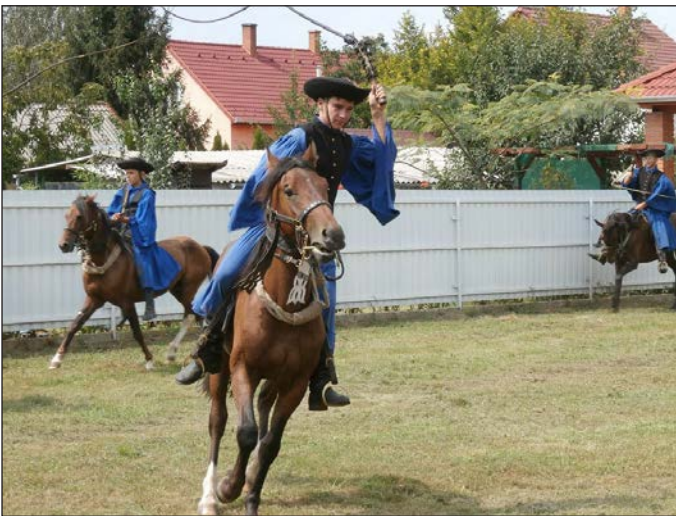
Ügyesen ülték meg a lovat a csikósok