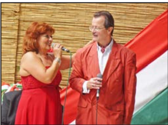
Szent István napi sokadalom 6-7. oldal