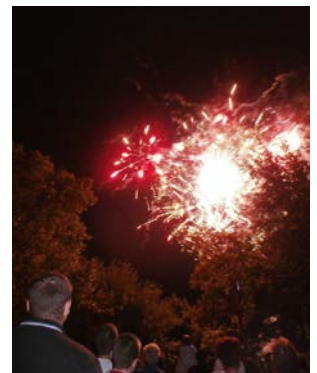
Káprázatos tűzijátékkal zárult a nap