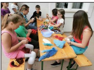
Szívárvány tábor 4. oldal