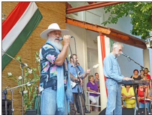
Az örök ifjú Apostol együttesre sokan voltak kíváncsiak