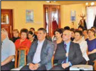
Család – gyermek – óvoda 3. oldal