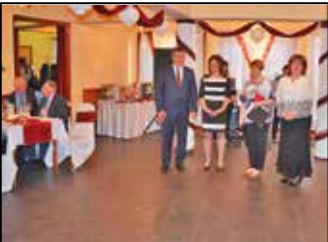
Ebes Község Bálja 6. oldal