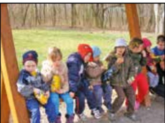
Kirándult az óvoda 9. oldal