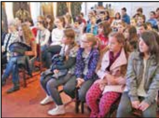
Költészet napi író-olvasó találkozó – 7. oldal