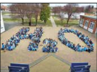
Iskolai hírek 10-11. oldal