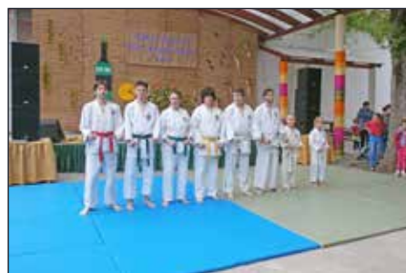
Különböző harci technikákkal mutatkozott be a Fehér Ökök karate szakosztály