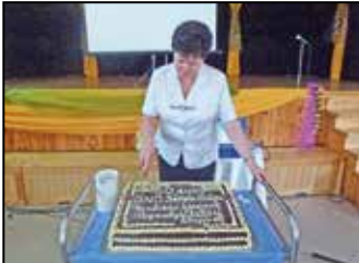
30 éves az ebesei Alapszolgáltatási Központ – 3. oldal