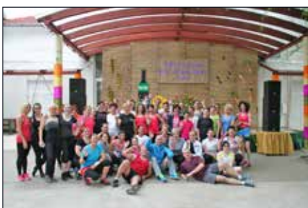
Tatarek Rezszi jól megmozgatta a korán kelőket