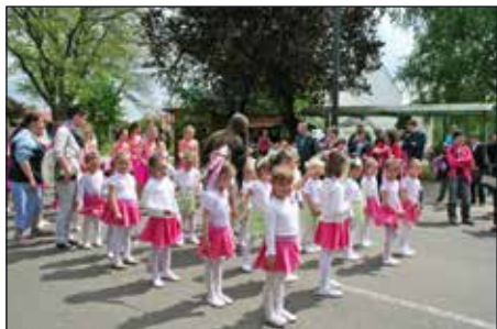
A mazsorettek parádés felvonulással szórakoztatták a közönséget

Bár az idő nem volt a legkegyesebb a majálisozókhoz, a remek hangulatot, jó kedvet még a kora esti eső sem tudta megzavarni. A sztárfellépők, a jó szervezés az ebesiek mellett még a környező településekről is idecsalogatta az embereket. Köszönetünket fejezzük ki a Magyar Sajt Kft.-nek, akik hozzájárultak a rendezvény sikeres lebonyolításához.