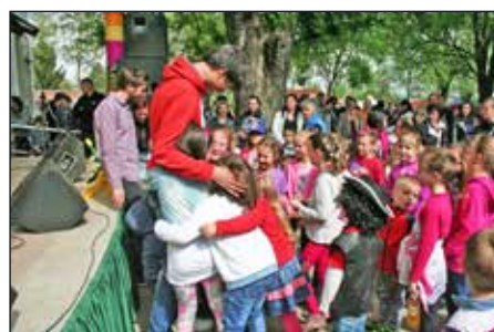
Tompeti és barátait nagy szeretettel fogadta az aprónép