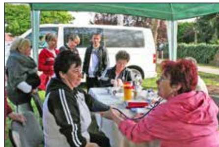
Az egészségsátorban vérnyomás, vércukor- és koleszterinszint mérést végeztek