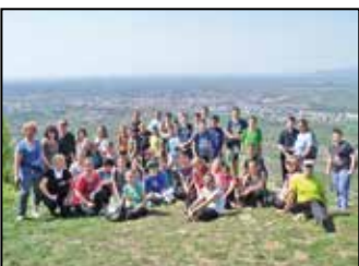
Iskolai színes hírek 9. oldal