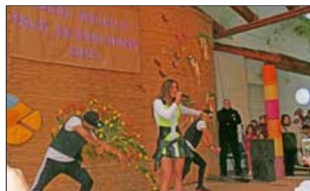
Dér Heni produkciójára tánccra perdültek a fiatalok