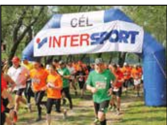
II. Tiszadada-Tiszadob gátfutás – 11. oldal