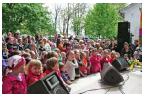
Számos kíváncsi szempár követte a fellépők előadását