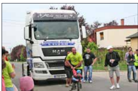
Az erős emberek is kipróbálhatták magukat