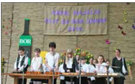
Az iskola citera szakköre és énekkara nagy sikert aratott