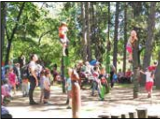
Kirándultak az óvodások 5. oldal