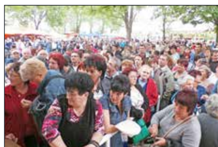
Sokan dalra fakadtak a közönségből