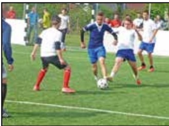
Majális 7. oldal