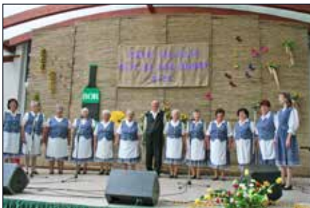
A Piros Rózsa Népdalkör népdalcsokorral kedveskedett a közönségnek