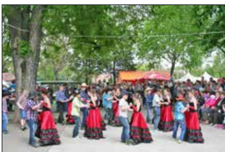
Igazi vadnyugati hangulatot varázsoltak produkciójukkal az iskolások