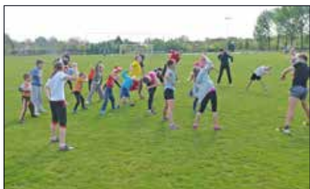
Egy kis mozgás mindenkinek kell – futás előtti bemelegítés