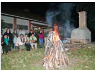
Múzeumok Éjszakája 5. oldal