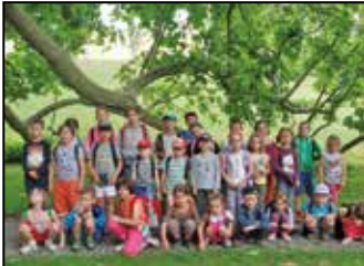
Felejthetetlen napok az Erdei Óvodában – 3. oldal