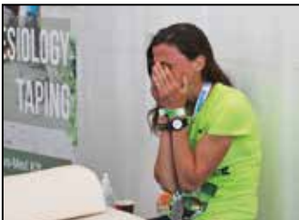
Az állóképesség példaképe 4. oldal