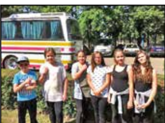
Iskolai színes hírek 8–9. oldal