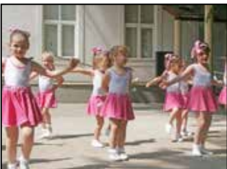
Gyereknapi Ebesen 4. oldal