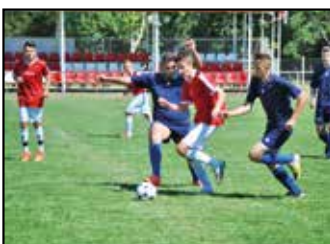
Megkezdte az edzéseket felnőtt együttesünk – 10. oldal