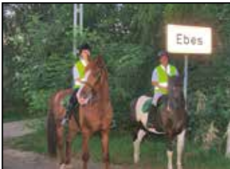
Polgárörök lóháton 5. oldal