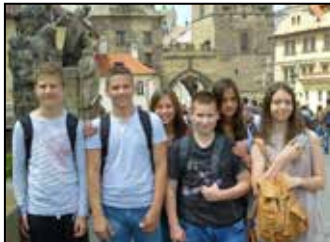
Iskolai hírek 4-5. oldal