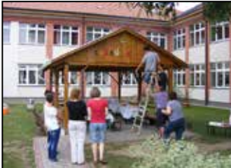
Lurkó-kuckó avatás 3. oldal