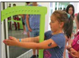
Szivárvány tábor 2015 8. oldal