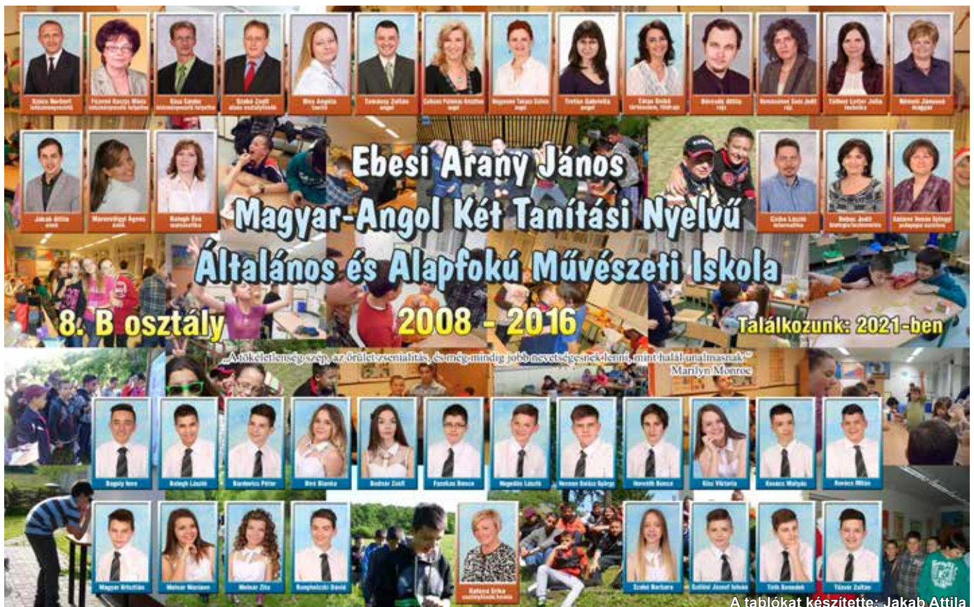
A táblókat készítette: Jakab Attila