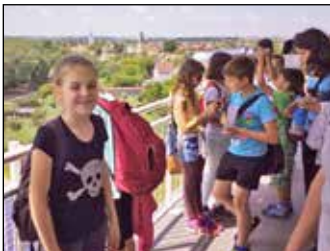
Az Ebesi Gyermekért Alapítvány hírei 9. oldal