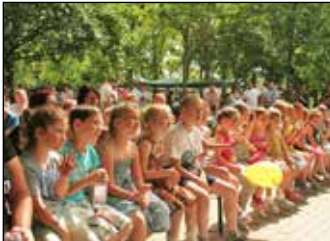
Gyereknapi 7. oldal