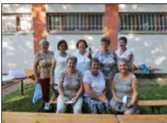
Nyári Esték Ebesen 9. oldal