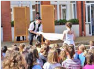
Iskolai színes hírek 4-5. oldal

Az Ebesi Hírlap mellékletében a képviselők 2015. évi önkormányzati munkájáról olvashatnak.