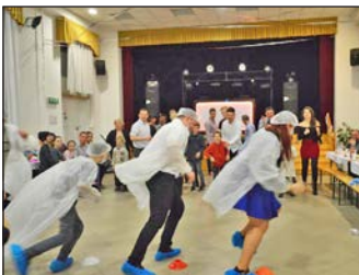
VIII. Batyus Sportbál 15. oldal