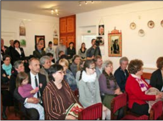
Kiállítás megnyitó 13. oldal