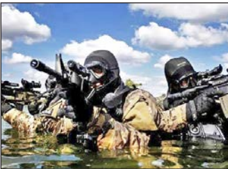
Katonai toborzó 14. oldal