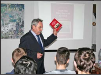
„Elhallgatott történelem” 13. oldal