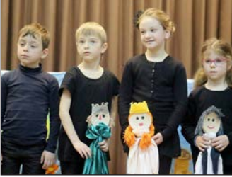
Báboztunk 10. oldal