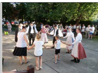
Szent Iván Éji Vigadalom 6. oldal