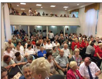
„Dalosok” találkozója 9. oldal