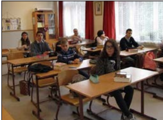
EGYA hírek 2. oldal