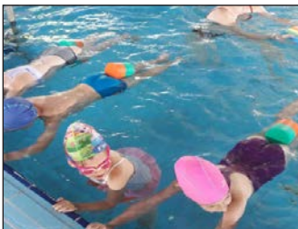
Vizes kaland az ovisoknak 3. oldal