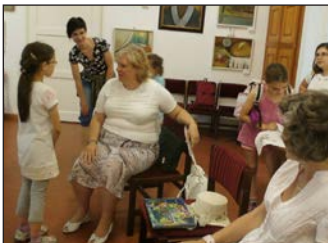
Ez történt az elmúlt időszakban Ebesen – 6. oldal