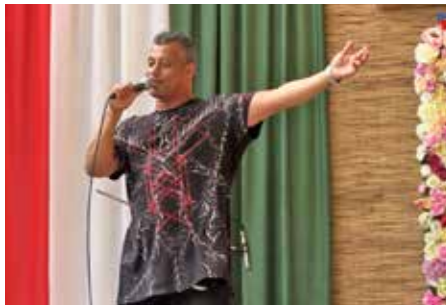
Bebe közvetlenségével gondoskodott a jó hangulatról