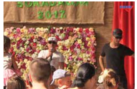
L.L Junior lendületes műsorral szórakoztatta a közönséget