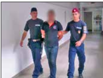
Rendőrségi hírek 10. oldal