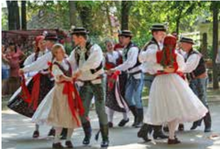
A Debreceni Virágkarneválról is ellátogattak hozzánk

a www.ebestv.hu oldalon.