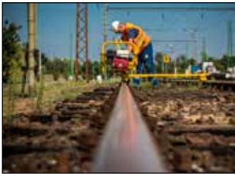
Vasútkorszerűsítés 5. oldal