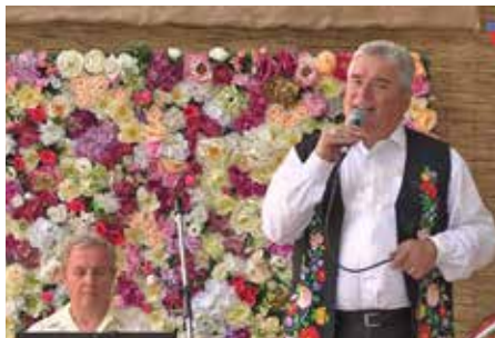
Jó ebédhez szólt a nóta