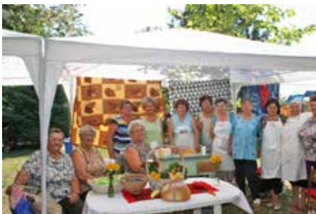
Idén az Ebesi Étek Mestere díjat az Ebesi Hagyományörző Egyesület vihette haza