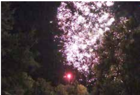
A tűzijáték ámulatba ejtette az ünneplőket