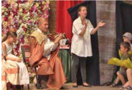
A kicsik is jól szórakoztak a rendezvényen