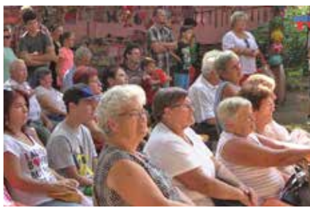
Sokan kíváncsian várták a fellépőket