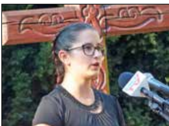
Koszorúzás 8. oldal