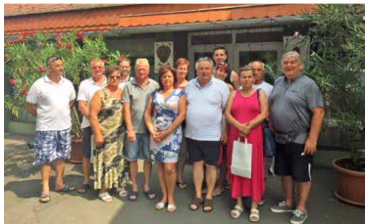
A balatonszárszói polgármesteri hivatal előtt

Ebes Községi Önkormányzat képviselő-testülete testvértelépülésünkre, Balatonszárszóra látogatott. Részt vettünk a hagyományosan, immár 7. alkalommal megrendezésre kerülő Sárkányfesztivál rendezvény színes programjain. Megtekintettük a település nevezetességeit, megcsodálhattuk a település rendezett, virágos köztereit, parkjait, mely méltán vonzza az idelátogató turistákat. Egyeztetünk az önkormányzatok előtt álló feladatokról, tapasztalatcserét folytattunk. Dorogi Sándor polgármester úr tájékoztatást nyújtott az önkormányzat további terveiről, megnyert pályázatairól, ismertette a település arculatához illeszkedő fejlesztéseket.