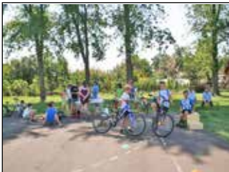
Sokadalom 6. oldal