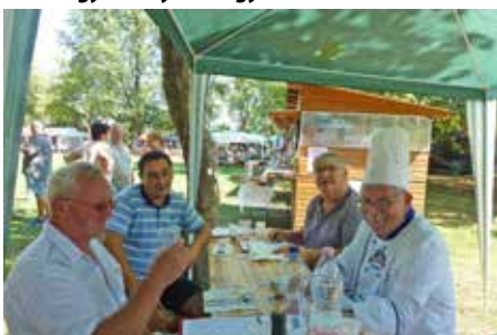
Munkában a zsűri