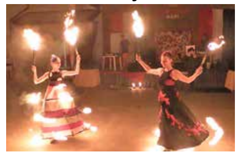
Tűztánc közben a sárkánylányok