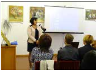
Múzeumpedagógiai évnívó 6. oldal