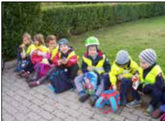
Mobilitás hét az oviban 3. oldal