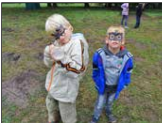
Fesztivál Ihaj-Csuhé módra 6. oldal