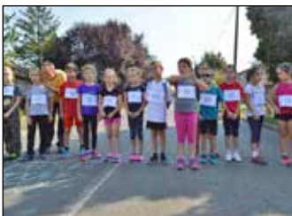
Két nap a sport jegyében 11. oldal