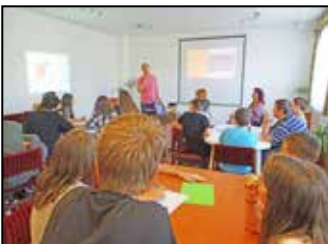
Kétszáz éve született Görgei Artúr – 8. oldal