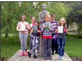
Iskolai színes hírek 5. oldal