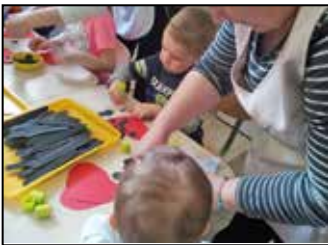
Tavaszyitogató az óvodában 6. oldal