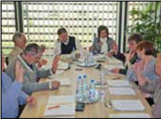
Beszámoló a testületi ülésről 2. oldal