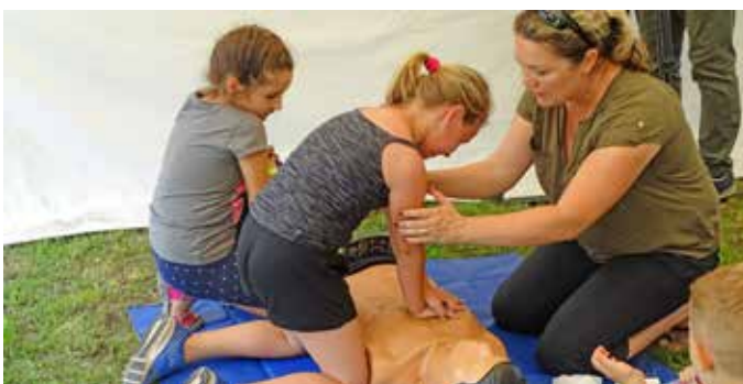
A Mentőszolgálat munkatársa az elsősegélynyújtás rejtelseibe vezette be az érdeklődőket