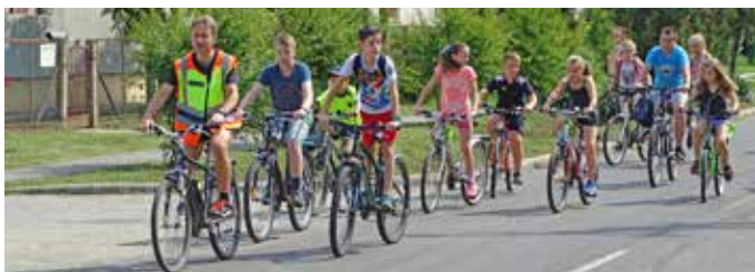
Kerékpáros felvonulással indult a délelőtt