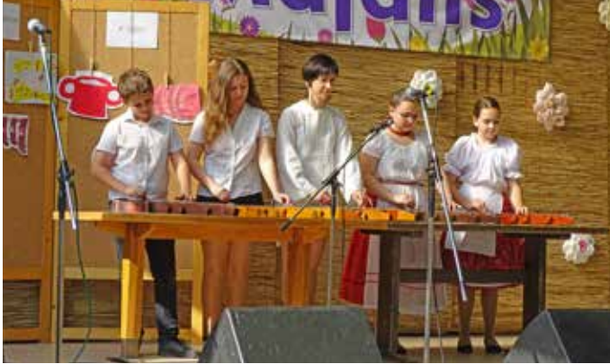
A citera zenekar mősora elbűvölte a közönséget

Kedvező időjárás, sportos délelőtt, remek előadók és lelkes közönség jellemezte az idei Majális Ebesen. A délelőtt folyamán a futók legnagyobb örömére ünnepélyesen átadásra került a futballpálya körül kialakított 500 méteres, salakos futókör, melyet örömmel vettek birtokba a kicsik és a nagyok egyaránt. A délután a szórakozás jegyében telt, hiszen az ebesi kicsik és nagyok műsorain túl olyan hírességek szórakoztatták a közönséget, mint Szűcs Judit, Gáspár Laci és Laci betyár. „Beszéljenek” a képek.