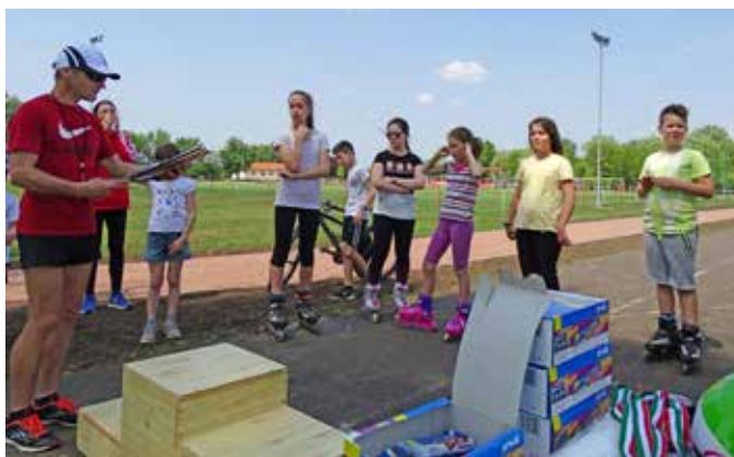
A sportdélelőttön számos sportágban összemérhették tudásukat az érdeklődők