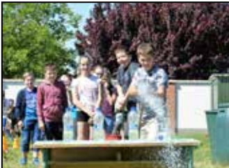
Iskolai színes hírek 4-5. oldal