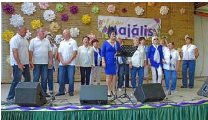
A Retró énekkar gondoskodott az igazi buli hangulatról