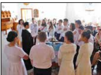
Konfirmáció a Református Templomban – 8. oldal