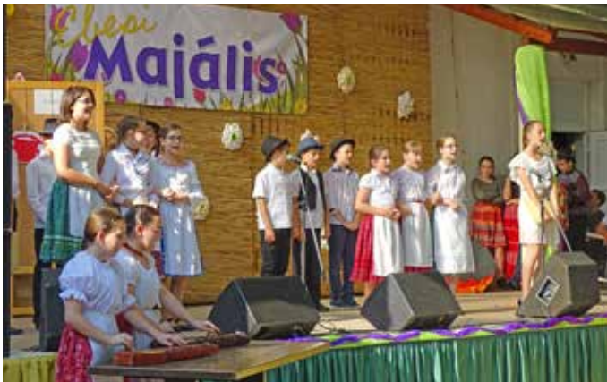
A rendezvényen az iskolásaink is felléptek