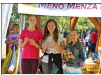
Beindult a Menő Menza Ebesen – 10. oldal