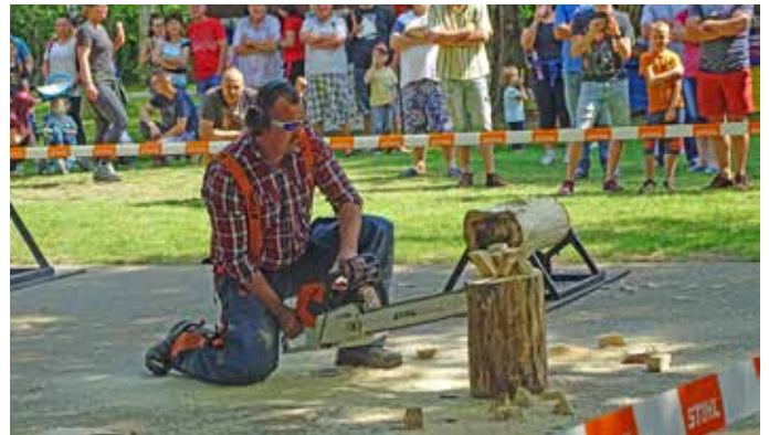
Extrém favágó show-val szórakoztatta a közönséget a Székelyhídi GV Team Sportklub