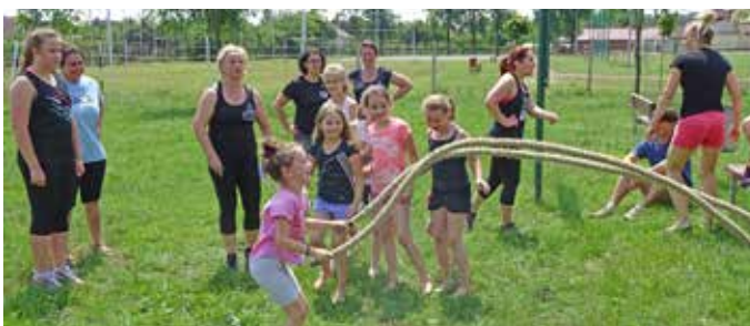
A legbátrabbak egy kemény Cross Fitness edzésen teheték próbára ügyességüket