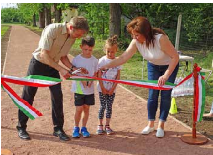
Átadásra került az új, 500 méteres salakos futókör