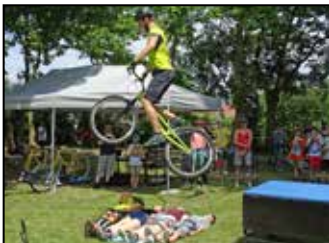
Sportnapoztunk 7. oldal