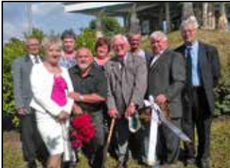
50 éves osztálytalálkozó 3. oldal