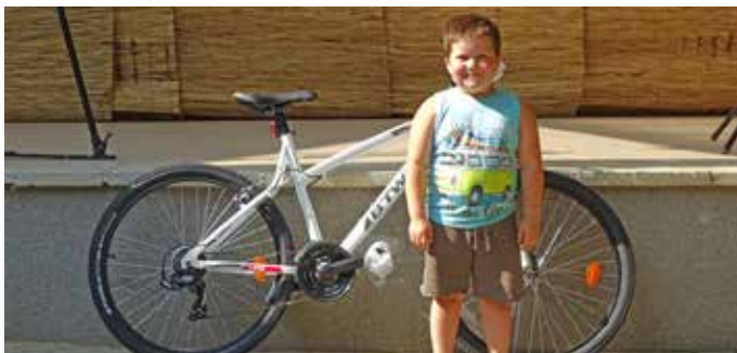
A nyeremény bicikli boldog tulajdonosa