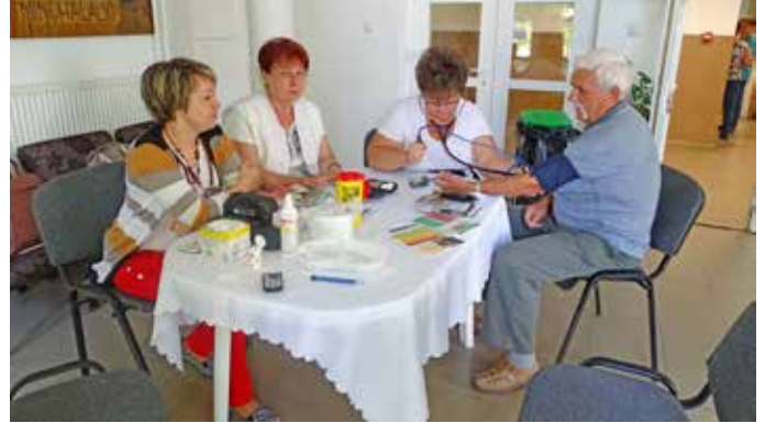
A délelőtt folyamán vércukrot és vérnyomást is mértek