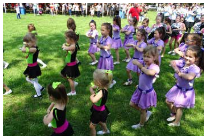
Mazsorett felvonulással kezdődött a délutáni programsorozat