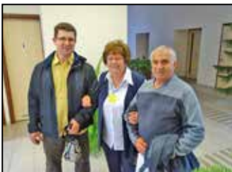
I. Ebesi Elszármazottak Találkozója – 8. oldal