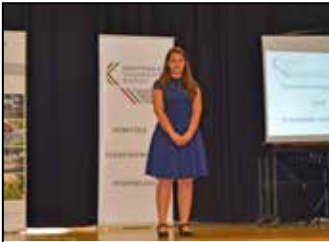
Iskolai színes hírek 4-5. oldal

Részletek: az újság 2. oldalán lévő felhívásban olvashatók. Nevezési lap: az újság mellékletében található.