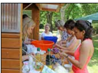
Egya hírek 9. oldal