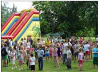
A gyerekeket ünnepeltük 6. oldal