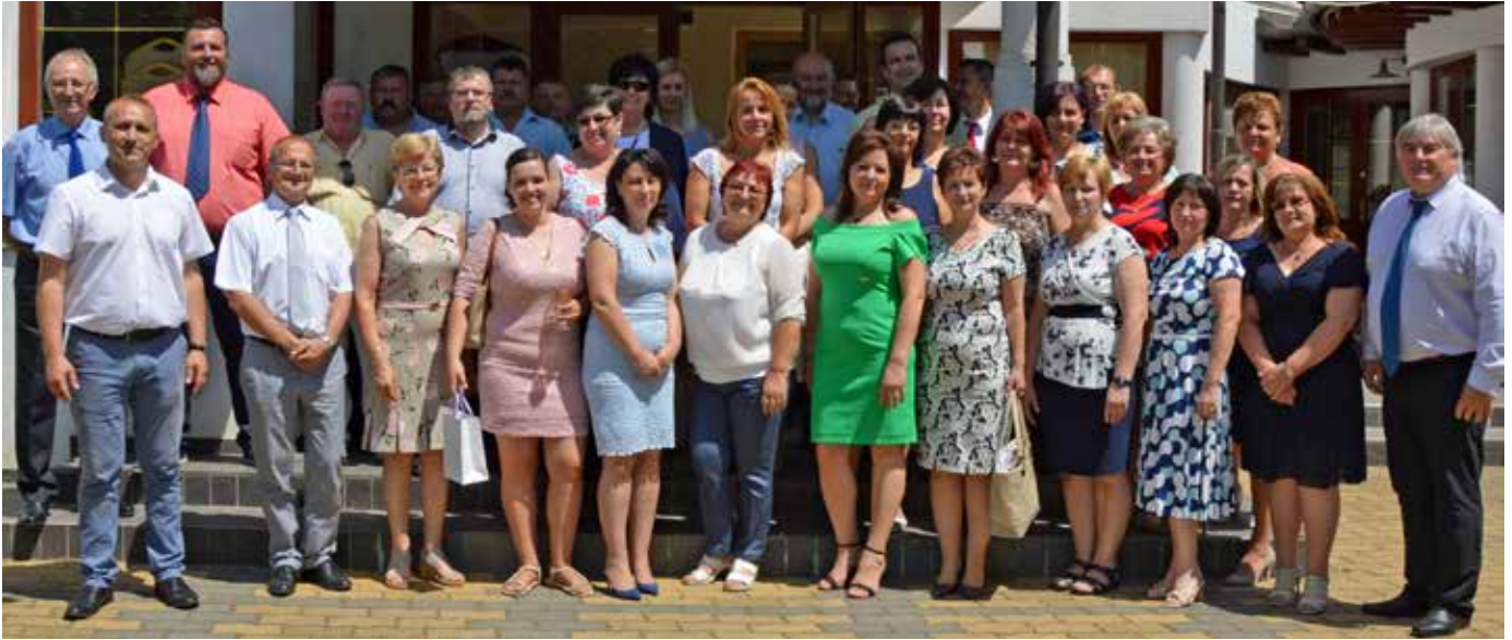
Ebes adott otthont a Berettyóújfalui Tankerületi Központ Pedagógusnapi rendezvényének