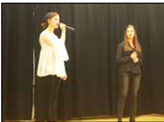
Farsangi batyus bál 4. oldal