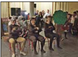
Báloztak az „óvodások” 8. oldal