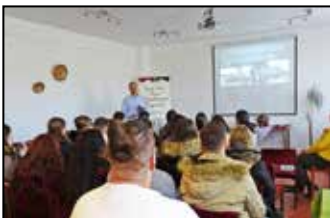
A kommunista diktatúrák áldozataira emlékeztünk 5. oldal