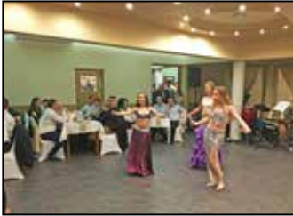
Ebes Község Bálja 3. oldal