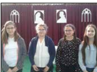
Iskolai hírek 9–10. oldal