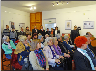
„9” – Szabadság és zsarnokság – 8. oldal