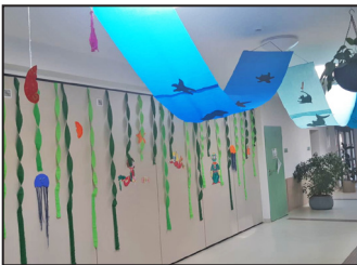
Kék Nap 9. oldal