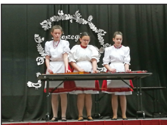
Népzenei Verseny 9. oldal