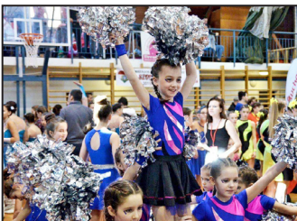
Mazsorett verseny 9. oldal