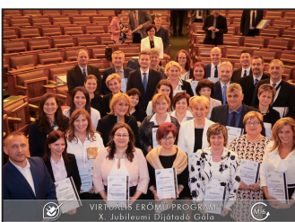
Színes iskolai hírek 10–11. oldal