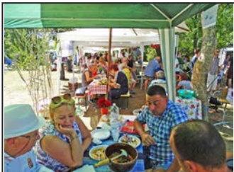
Szent István Napi Sokadalom – 6. oldal