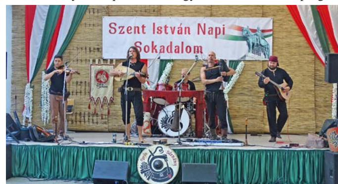
A Bordó Sárkány Régiózenekar megidézte a középkor hangulatát

meztalálták a számításukat a nóta, a mulatós és a népzene, mint akár a populárisabb, akár az extrémebb műfajok kedvelői, idősebbek és fiatalabbak egyaránt. A színes, progra-