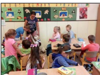
Színes iskolai hírek 11. oldal