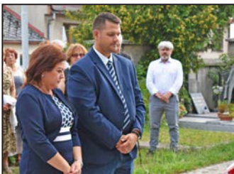
Koszorúzás Ebes testvérvárosában – 6. oldal