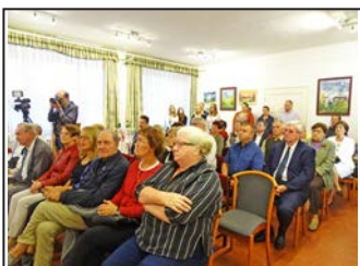
Jubileumi kiállítás megnyitó a múzeumban – 9. oldal