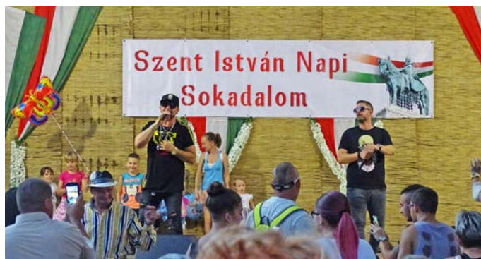
Kozsó és az Ámokfutók semmit nem vesztek népszerűségükből

mokban gazdag napot ünnepli Ezúton Szeretnénk megköszönni a KETER Hungary Kft-nek a Főzőverseny díjazásában nyújtott segítséget.