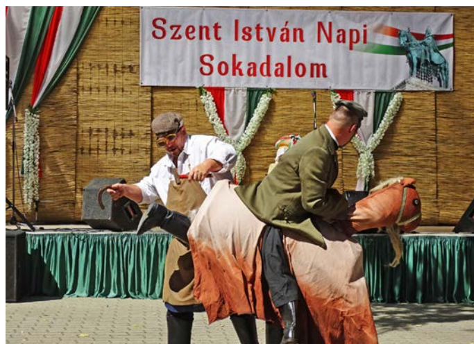
A Bihari Banda színvonalas és humoros műsora sokakat megnevette

Első királyunk emléknapján országosra emelték a magyar állam megalapítására emlékezőnk nyekkel és vásárral egybekötött zenés rendezvény várta az érdeklődőket, ahol ugyanúgy