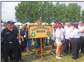
Polgárőr Találkozó 9. oldal