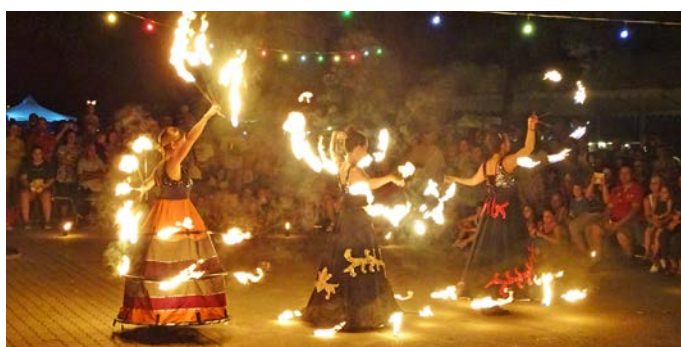
A Sárkánylányok tűzszonglór produkciója százakat nyűgözött le

mokban gazdag napot ünnepli Ezúton Szeretnénk megköszönni a KETER Hungary Kft-nek a Főzőverseny díjazásában nyújtott segítséget.