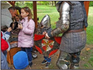
Hátrányos helyzetű gyerekek a múzeumban – 4. oldal