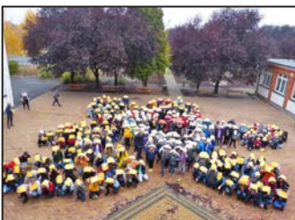
Iskolai színes hírek 10. oldal