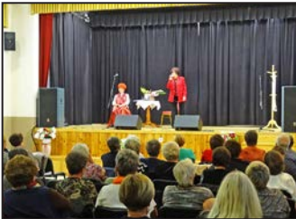
Múzeumok Őszi Fesztiválja 2019. – 5. oldal