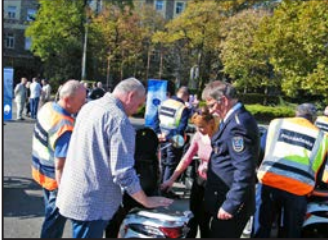
Új utakon, új járművekkel 3. oldal