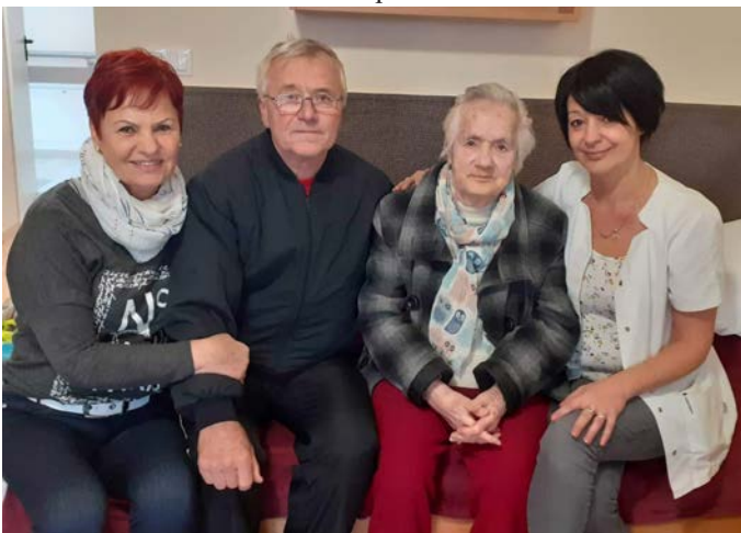
Családias hangulat az idősek otthonában

Örömmel tudatjuk a Kedves Lakossággal, hogy 2019. november 21-én az Idősek Otthonába beköltöztek az intézmény első lakói. Az előkészületekkel párhuzamosan november köze-