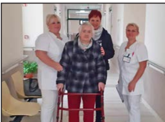
Megnyitotta kapuit az Idősek Otthona – 8. oldal