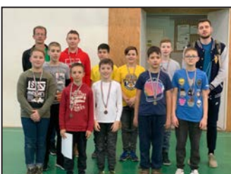
Iskolai színes hírek 10–11. oldal