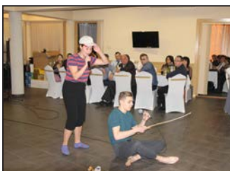
Ebes Község Bálja 10. oldal