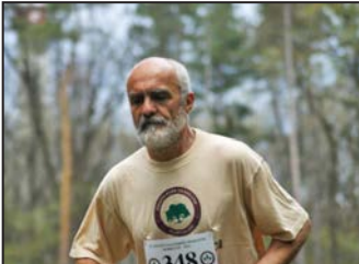
Kortalan futás 3. oldal