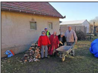
Hol nagy a szükség, közel a segítség – 5. oldal