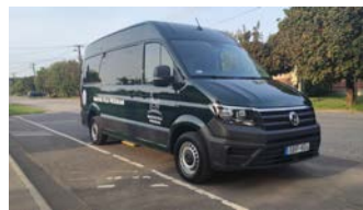
Szabóné Karsai Mária polgármester

Településünk új gépjárművel gazdagodott, melynek fedezetét pályázati forrás biztosította. A Magyar Falu Program keretében közel 15 millió forint értékben vásárolt új 12 személyes kisbusz a települési feladatokban fog aktívan közreműködni. Beszerzése hozzájárul a vidéki kistelepülések hátrányainak mérsékléséhez, az életminőség és a közszolgáltatások elérhetőségének javításához, valamint az ifjúság vidékhez való kötődéséhez.