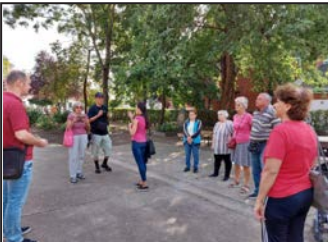
Kulturális Örökség Napjai 6. oldal