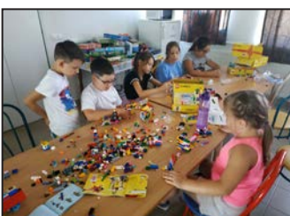
Iskolai hírek 11. oldal