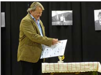
Pustolt a hó 9. oldal