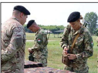
Speciális tartalékosként a seregben – 10. oldal