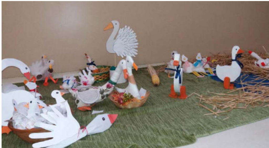
Libakiállítás az óvoda folyosóján