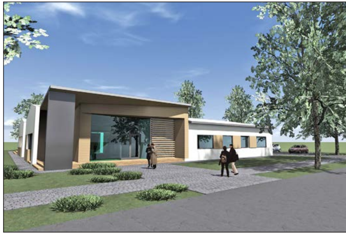
Az új polgármesteri hivatal látványterve