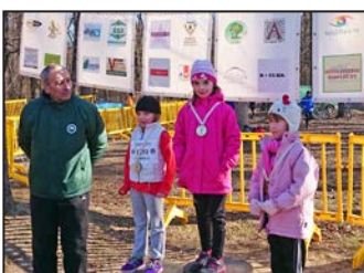
Jól kezdődik az év a futóknál – 10. oldal