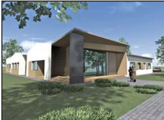
Interjú a költségvetésről 2. oldal