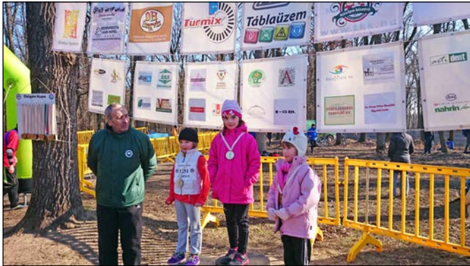
Egri Kincső negyedik győzelme