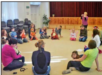
Farsang a Zenébölcsiben 7. oldal