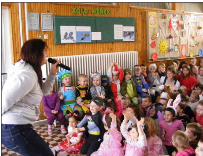
Elbúcsúztatták a telet az óvodások