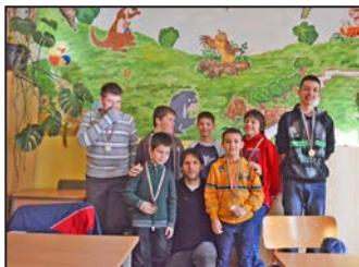
Iskolai színes hírek 4-5. oldal