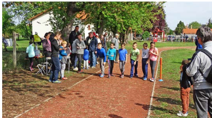
A délelőtti folyamán több sportágban is próbára teheték magukat az érdeklődők