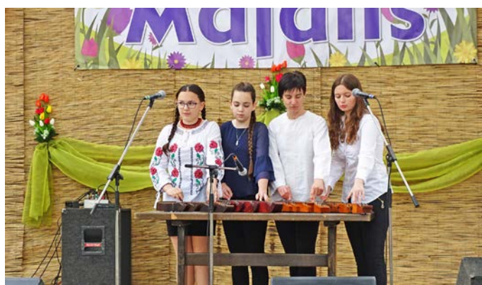
Az Ebesi Művelődési Ház Kéknefelejcs Citeraegyüttese színvonalas műsort nyújtott