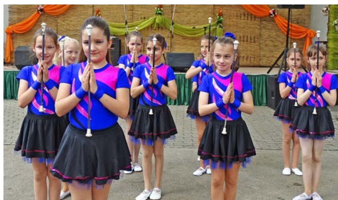
A mazzorett csoportok produkciói idén is nagy sikert arattak