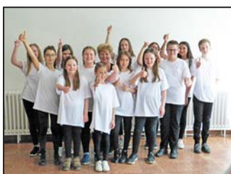
Színes iskolai hírek 9–10. oldal