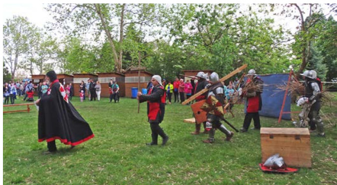
A Zsongvölgyi Hagyományörző Egyesületnek köszönhetően a középkor világában érezhették magukat az érdeklődők