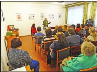
Író-olvasó találkozó 7. oldal