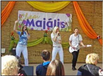
Ebesi Majális 2019 6. oldal