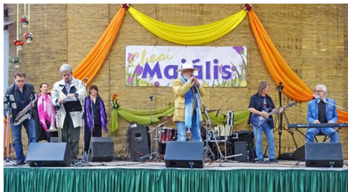
A rendezvényt a legendás Apostol zenekar fergeteges koncertje zárta