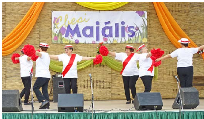
Az Ebesi Hagyományörző Egyesület színes és vidám sora nyitotta meg a délutánt