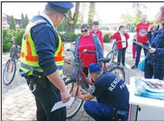
Kerekezzünk együtt! 7. oldal