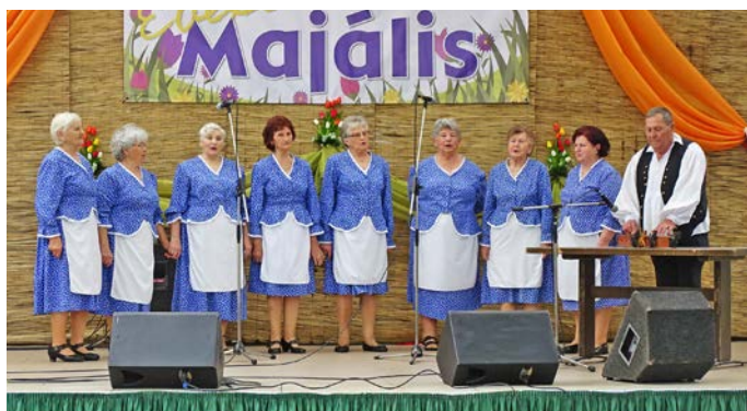
Az Ebesi Piros Rózsa Népdalkör a népdalok legjobb kincseiből nyújtott át egy csokrot a hallgatóságnak