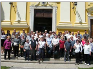
Olivér 8. oldal